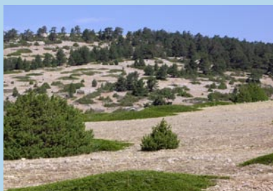
Sabinas albares (manchas verdes del suelo)

Km 28,7 Llegamos a la partida de Las Blancas y nos encontramos a una altitud de 1520 m sobre el nivel del mar. Después descendemos por la senda próxima al corral de Las Blancas