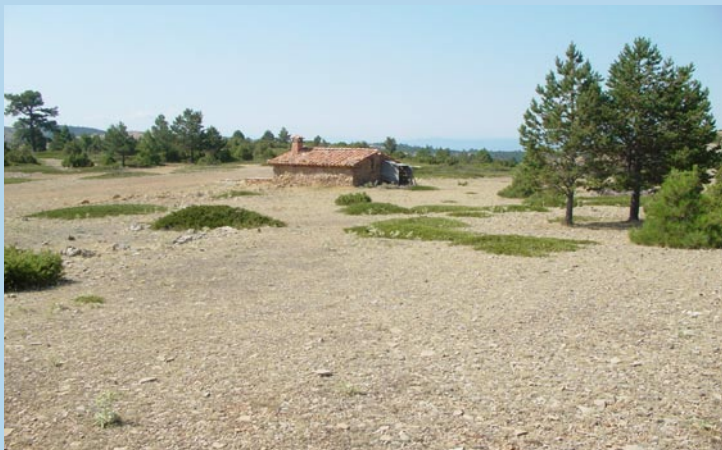
Refugio del Collado Buey

Del refugio bajamos por la rambleta hasta llegar al fondo del barranco del Saladillo, abandonándolo por una senda a la izquierda que asciende entre pinos. Este paraje era zona